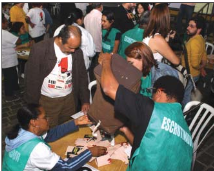
As eleições ocorreram em 21 de maio, em 49 postos de votação distribuídos pela cidade; a apuração dos votos para a Diretoria que comandará o sindicato nos próximos três anos teve início no mesmo dia, no Centro Cultural do SINPEEM, e só foi concluída na madrugada de 22 de maio.