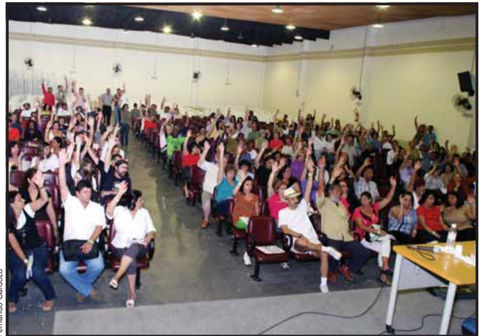
Maioria aprovou nova assembleia geral para o dia 17 de abril

Na assembleia de 21 de março também foram aprovadas as composições dos integrantes do Conselho Fiscal do SINPEEM e do Conselho da Confederação Nacional dos Trabalhadores em Educação (CNTE) e definidos os critérios e delegados para os congressos estadual e nacional da Central Única dos Trabalhadores (CUT). Foi aprovada, ainda, a realização de seminário sobre jornadas de trabalho, regência e complementação de jornada (CJ), com data a ser definida pela Diretoria.