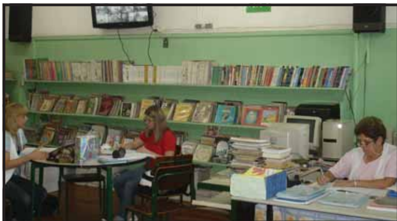
A Emef possui sistema integrado de TV em todas as suas dependências

O SINPEEM tem percorrido as escolas da rede municipal e ouvido relatos de diretores, docentes e equipes técnicas, que garantem ter conseguido melhorar a qualidade do ensino nestas unidades a partir de um trabalho conjunto.