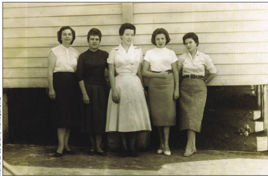
Memorial do Ensino Municipal/SME

A Prefeitura propôs que cada um destes profissionais fizesse um cadastro de 40 alunos que estivessem fora da escola e encontrassem salas disponíveis para lecionar. A princípio, os professores pagariam o aluguel das salas com os salários que recebiam da Prefeitura e, em contrapartida, seriam nomeados